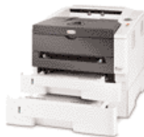
PF-100 Depósito de papel

El producto mostrado incluye elementos opcionales