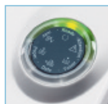
LED panel de control para un sencillo manejo

Una resolución de 1.200 ppp garantiza textos claros y gráficos nítidos